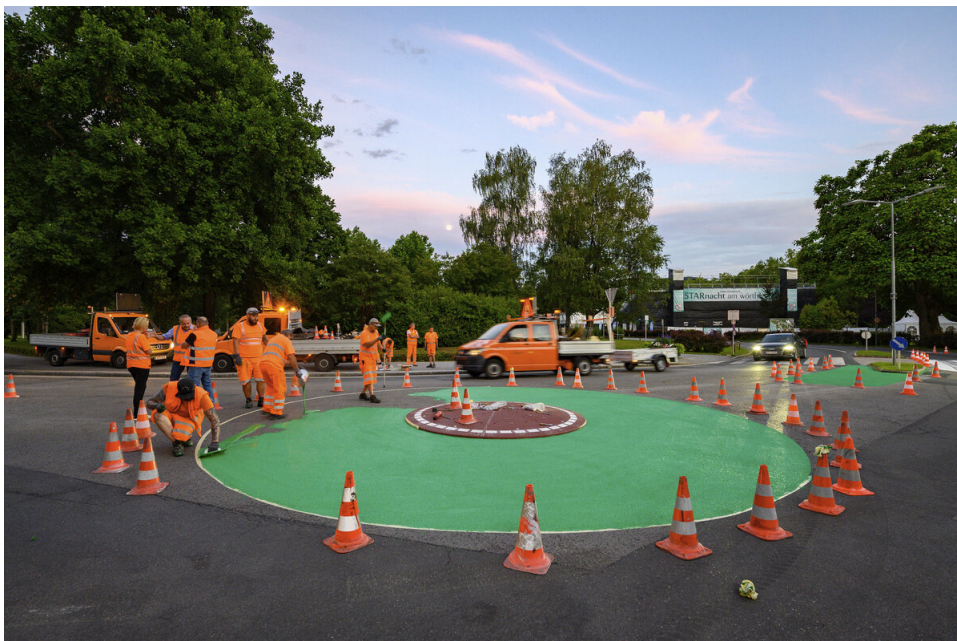
Klagenfurt: Minikreisverkehr mit Bausatz-Mittelinsel für 10.000 €

Laut § 32d der Straßenverkehrs-Zulassungs-Ordnung (StVZO) sind höchstens 12,5 Meter Wendekreis für die Straßenzulassung eines Fahrzeugs erlaubt.